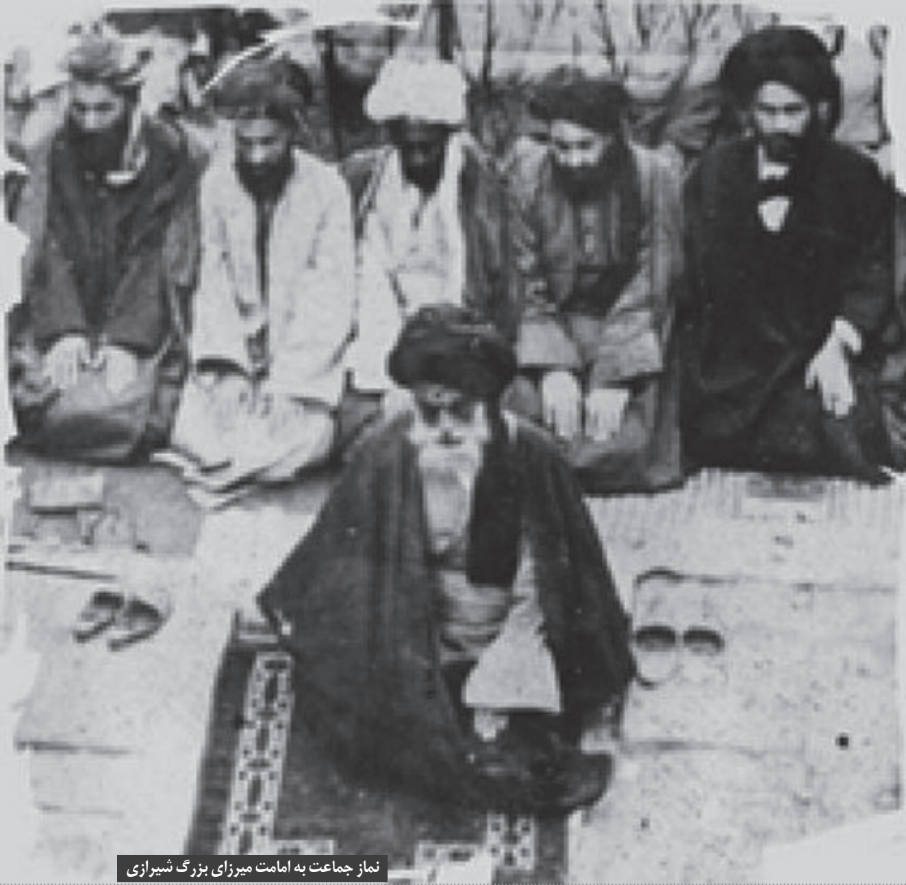
نماز جماعت به امامت میرزای بزرگ شیرازی

پس از رحلت میرزای شیرازی که سرزمین عراق و عتبات عالیات توسط قوای انگلیس اشغال شد و در پی آن، انقلاب عشرين ۱۹۲۰ رخ داد، ایادی انگلیس از اتحاد شیعه و سنی در عراق به شدت در هراس و اضطراب بودند؛ لذا در صدد اختلاف افکندن میان شیعه و سنی بودند تا بتوانند به راحتی بر عراق حکومت کنند.