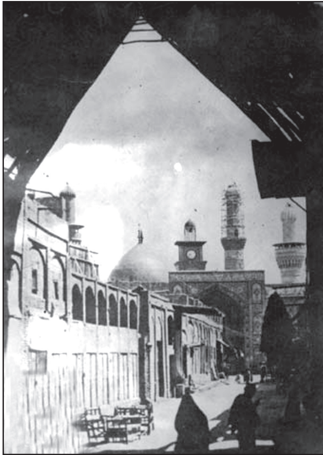
کربلا / حرم حسینی

عبارات در این باره، متفاوت می باشند؛ گاهی «کنار پاهای» و گاهی «سمت پاهای» آمده که هر دو به یک معناست. این که محل دفن علی بن حسین علیه السلام از دیگر شهدا به پیکر امام حسین علیه السلام نزدیک تر است، اتفاقی است؛ چون برای وی در کنار پاهای پدر بزرگوارش گودالی حفر کردند و در آن جا، او را به خاک سپردند.