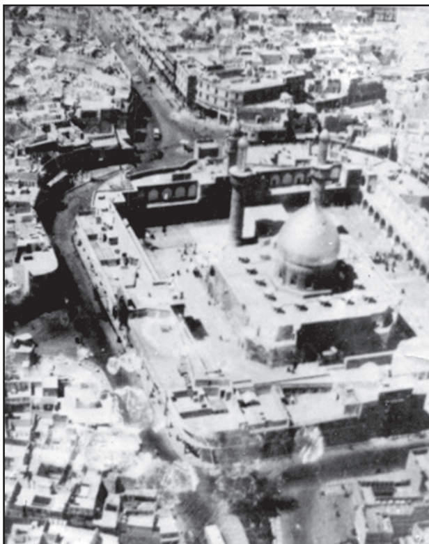
کربلا / تصویر هوایی از حرم حسینی

ظاهر عبارت «پلی رجه»، اتصال قبر شهدا به قبر سیدالشهداء است؛ همچنان که درباره قبر علی بن حسین علیه السلام نیز این اتصال وجود دارد و منافاتی بین این تعبیر و تعبیر «عنه؛ نزد» و «نحو؛ جانب» که در بعض روایات آمده، وجود ندارد.